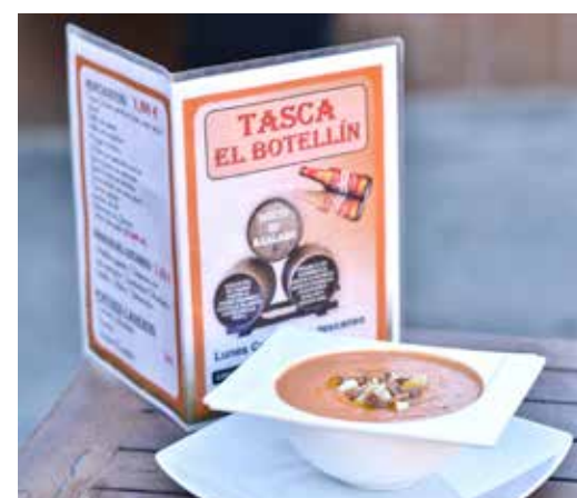
Tapa de salmorejo.