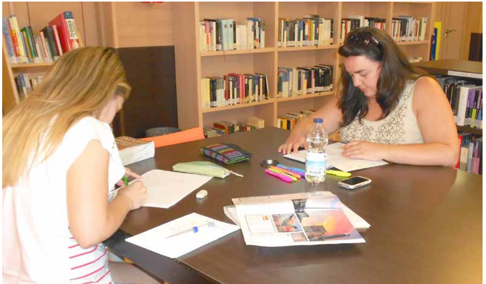
Dos jóvenes estudiando en las instalaciones de la Biblioteca Municipal.

que más le hubiera gustado. Sin embargo, no es el único que tiene que recurrir a descartar su carrera