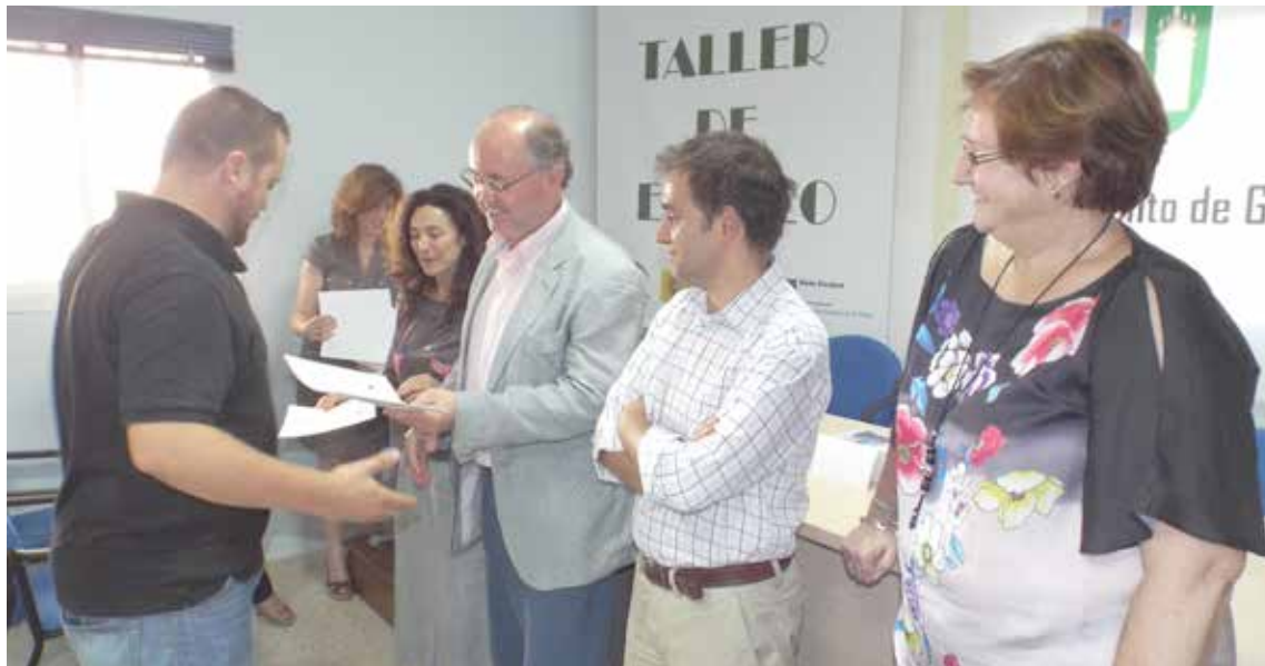
El taller concluyó con la entrega de diplomas.

El Taller de Empleo “Gines Sostenible”, puesto en marcha desde la Agencia de Desarrollo Local del Ayuntamiento, ha concluido recientemente tras dar trabajo y formación durante un año a una veintena de desempleados del municipio mayores de 25 años. Esta acción formativa ha venido subvencionada por la Consejería de Educación de la Junta de Andalucía y cofinanciada por el Fondo Social Europeo, constando de dos módulos, uno de Atención a personas dependientes y otro de Auxiliar en atención socioeducativa de menores, cada uno con 10 alumnos-trabajadores. A lo largo del último año, todos han recibido una importante capacitación profesional en sus respectivas áreas, completando la formación teórica con prácticas en los servicios sociales municipales, en diferentes centros de atención a dependientes, y en los distintos centros educativos de la localidad. En el acto de clausura estuvieron presentes la Directora de la Agen-