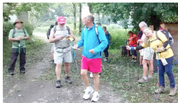
“La Cigüeña” seguirá realizando próximamente nuevas rutas.