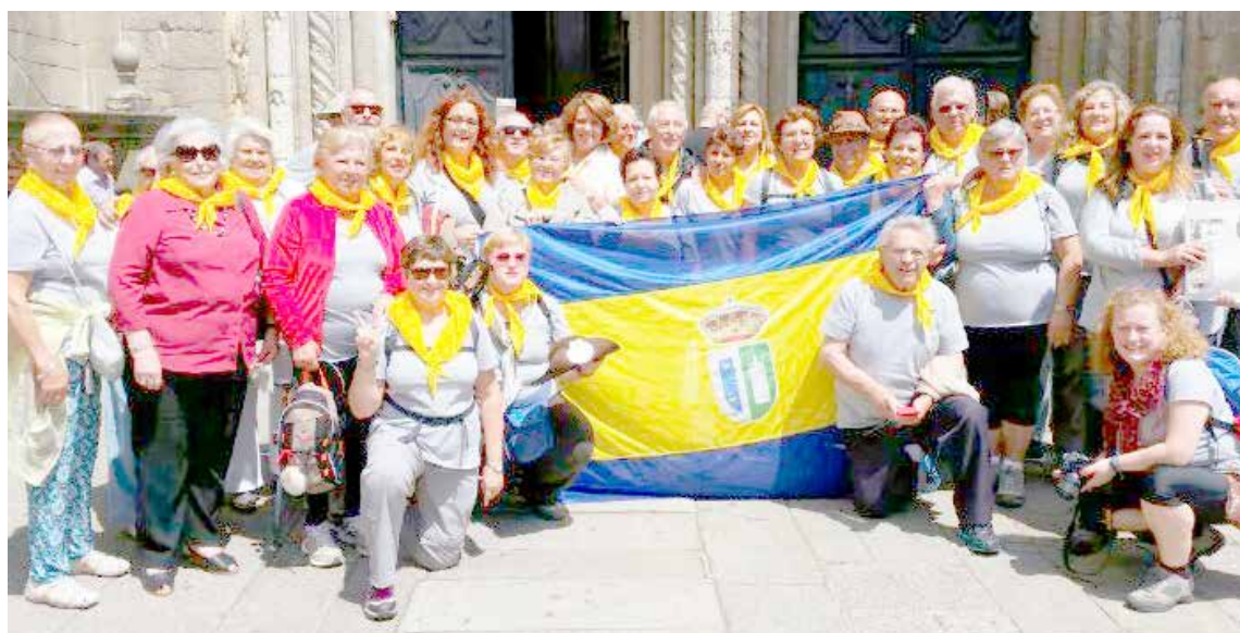
El grupo, con una bandera de Gines a su llegada a Santiago.

» Esta salida es la más importante de las realizadas por el grupo hasta el momento