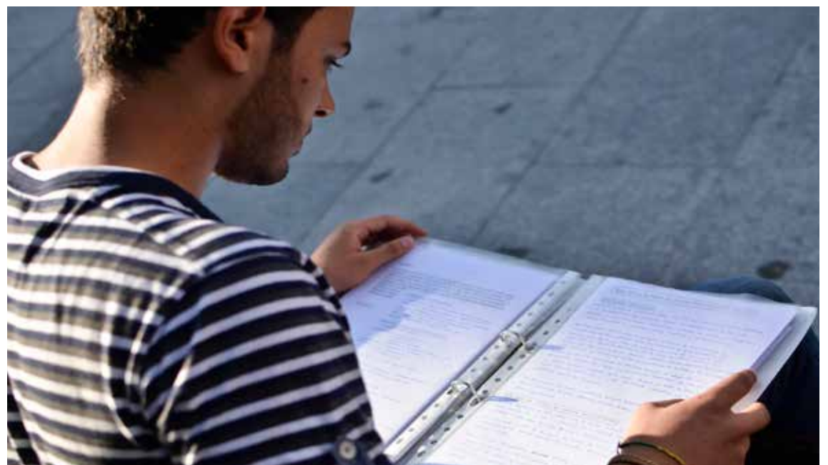
Los apuntes, base fundamental del alumnado en el día a día.