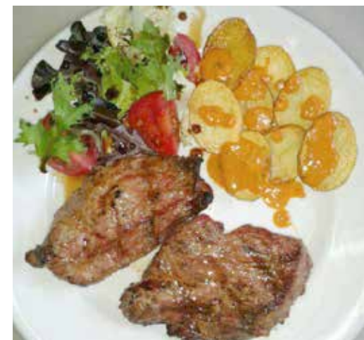
Medallones de presa ibérica.