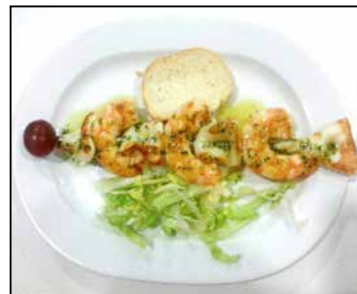
Brocheta de chipirones y langostinos.