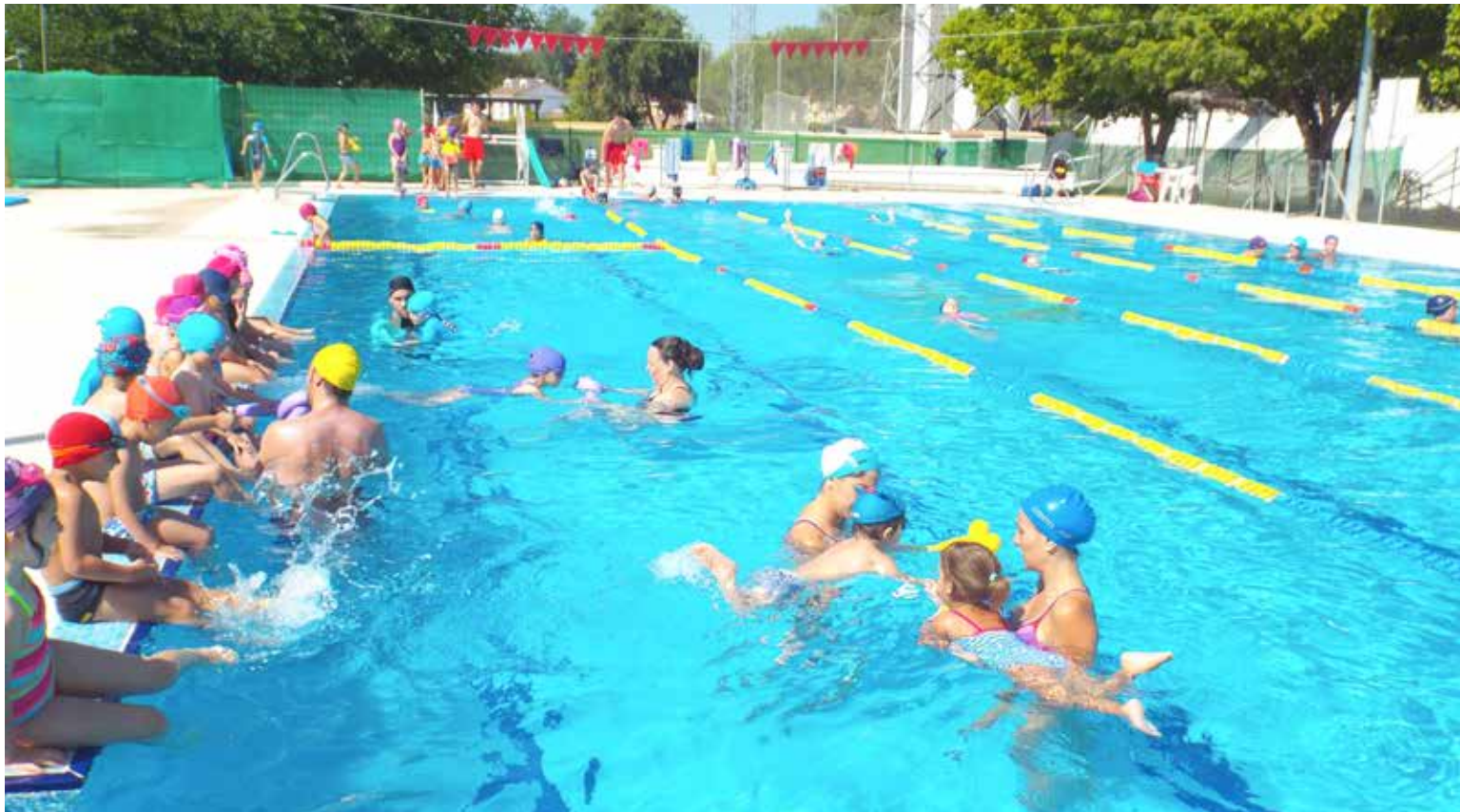
La piscina ofrece diferentes cursos de natación y también baño libre.

Consciente de ello, desde el Ayuntamiento se ofertan numerosas actividades especialmente pensadas para el público infantil. Es el caso del Campamento Urbano, una propuesta ya plenamente asentada en la localidad y que cuenta cada año con una gran cantidad de pequeños de entre 3 y 12 años, que disfrutan de actividades de todo tipo, desde deportivas hasta artísticas y de apoyo. El Campamento funcionará hasta principios de septiembre en horario de 9.00 a 14.00 o de 7.30 a 15.30 horas, según las necesidades de cada familia, que pueden formalizar