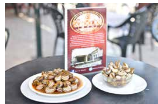
Cabrillas y caracoles.