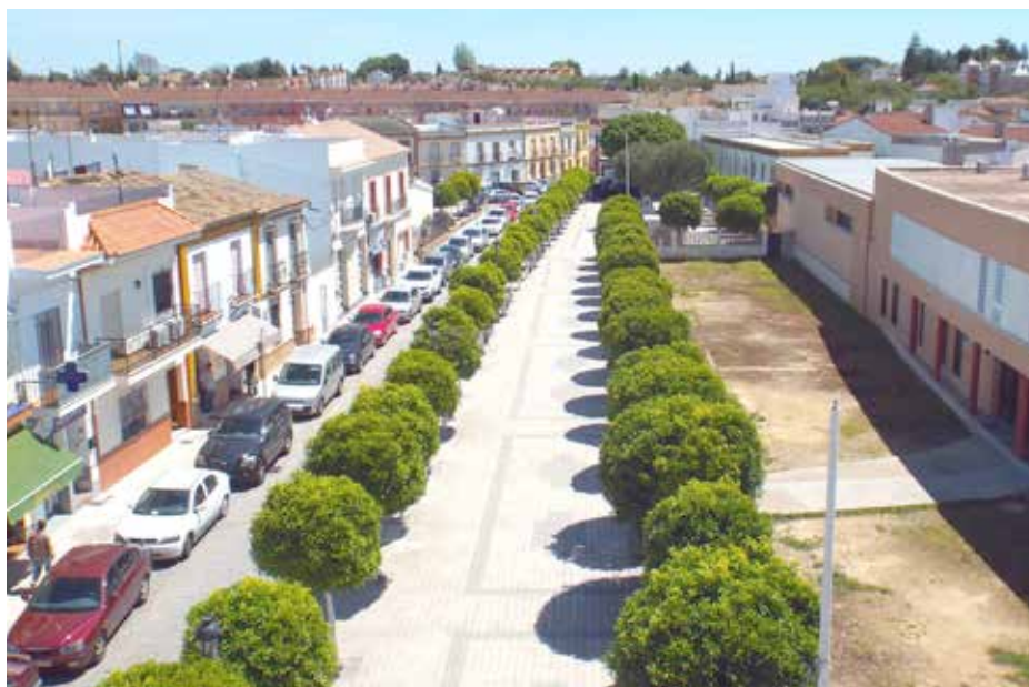
Vista actual del Paseo.

El plazo de ejecución estimado es de seis meses desde el inicio de